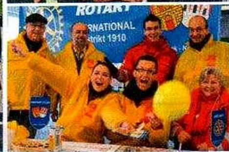
Jung und alt eng beieinander. Der Anteil der älteren Clubmitglieder wächst.

den weltweiten Brennpunkten, deswegen gibt es die Projekte der Clubs und der Gesamtgemeinschaft über die Foundation. Mit Ausnahme des Jugendaustauschs sind sie bisher ausschließlich nach außen gerichtet. Damit ist Rotary eine Serviceorganisation. Rotary will zweitens den Blick über Berufsweg weiten, deswegen das Auswahlprinzip nach Berufsqualifikationen, die pro Club jeweils einmal vertreten sein sollen. Damit ein Club der Professionen. Rotary ist schließlich ein Freundesclub auf Lebenszeit, deswegen die Active-Senior-Membership (ASM)-Regelung.